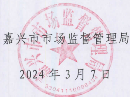
嘉兴市市场监督管理局