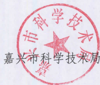
嘉兴市科学技术局