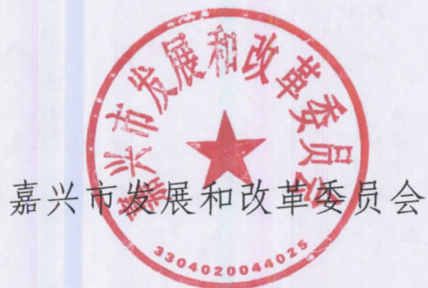
嘉兴市发展和改革委员会

门深入做好区域细胞制备中心建设的技术指导、安全监督、生产监管等相关工作，强化细胞制备单位的规范管理，切实推动我市细胞产业的有序发展。